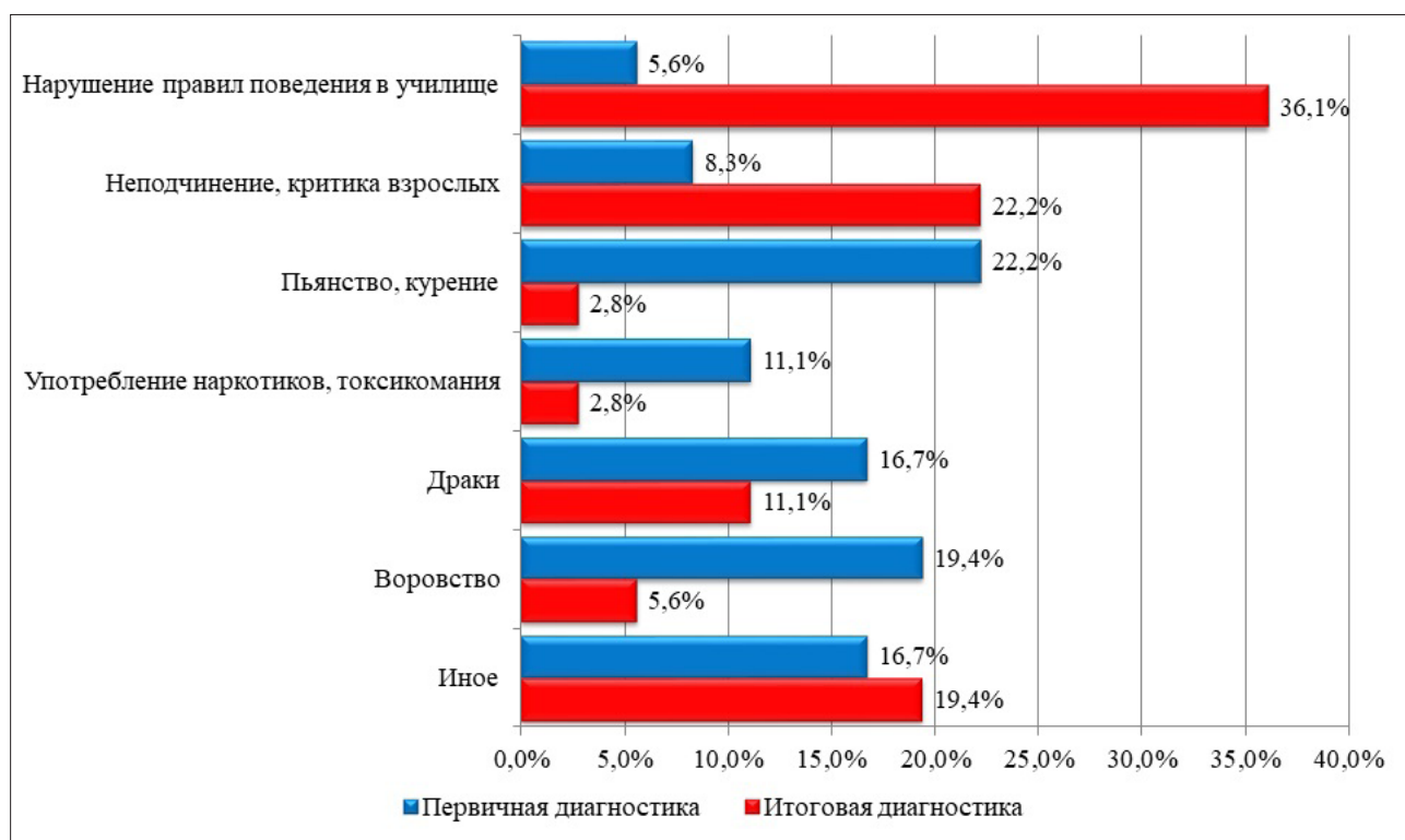
Рис. 2. Результаты первичного и итогового опроса сотрудников курсов о сущности девиации у старших подростков в суворовских военных училищах МВД России

До апробирования разработанной Программы (первичная диагностика) и после (итоговая диагностика) проводился опрос среди сотрудников курсов Астраханского СВУ МВД России. Вопросы были сгруппированы в два кластера: о сущности девиации у старших подростков и профилактике такого поведения. Каждому из респондентов предоставлялись готовые варианты ответов и возможность высказать собственный вариант, при этом количество выборов могло быть от одного до четырех. Результаты первичного и итогового опроса о сущности девиации у старших подростков представлены на рисунке 2.