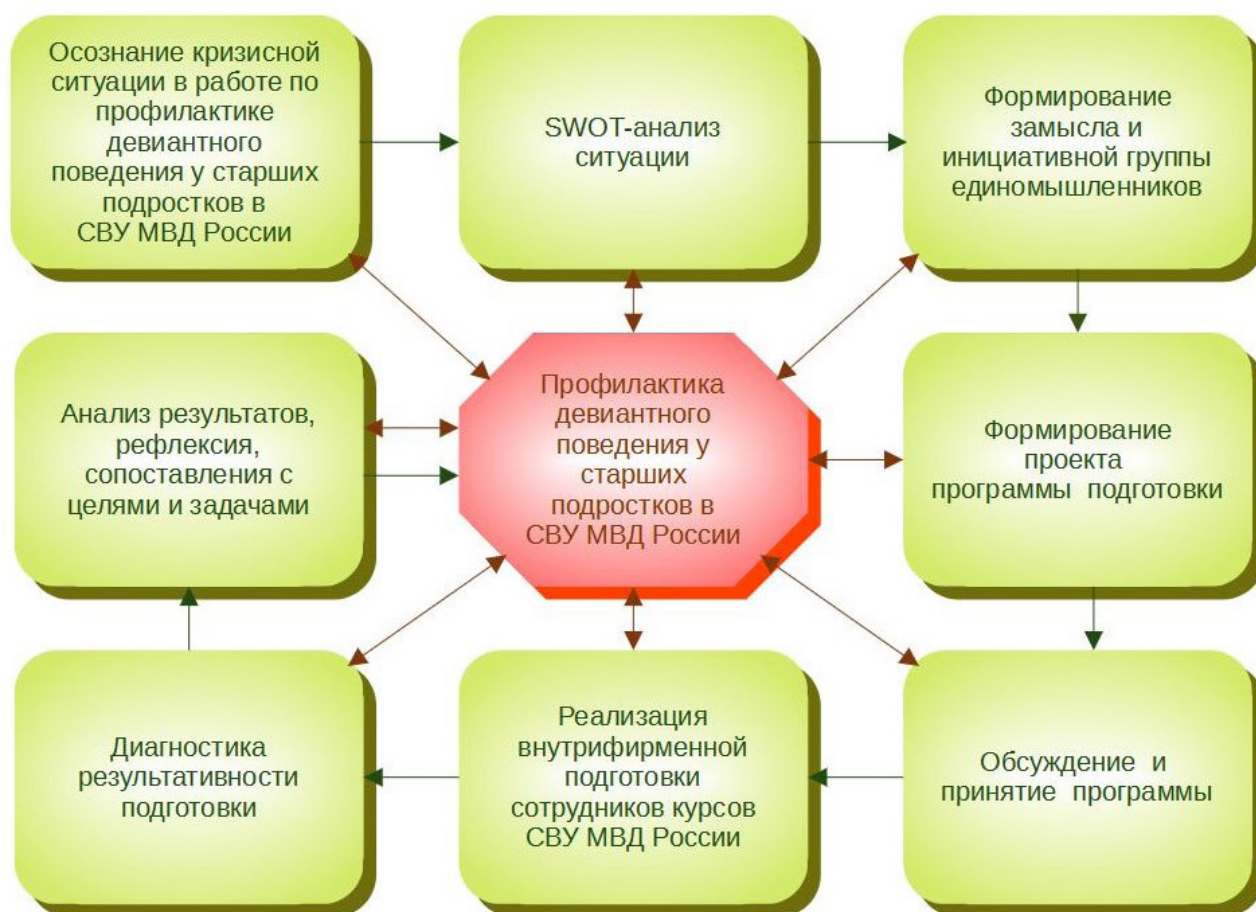
Рис. 1. Модель внутрифирменной подготовки сотрудников курсов суворовских военных училищ МВД России к работе по профилактике девиантного поведения у старших подростков

Охарактеризуем каждый из блоков в их импликационной взаимосвязи друг с другом. Осознание реальной ситуации заинтересованными лицами, прежде всего руководством образовательной организации, в сфере профилактики девиантного поведения у старших подростков в СВУ МВД России является отправной точкой проектирования программы подготовки. Проводимый далее SWOT-анализ – стратегический инструмент, оценивающий четыре аспекта педагогической реальности в своей антиномии (сильные и слабые стороны, возможности и риски) (Benzaghta et al., 2021). Результаты SWOT-анализа определяют замысел программы подготовки сотрудников курсов к работе по профилактике девиантного поведения у старших подростков, формируется инициативная группа единомышленников. Замысел преобразуется в проект программы подготовки сотрудников курсов СВУ МВД России к работе по профилактике девиантного поведения у старших подростков (далее – Программа). Программа рассматривается на педагогическом совете образовательной организации, где педагогический коллектив обсуждает ее содержание, принимает решение о реализации, а также может рекомендовать внести необходимые корректировки.