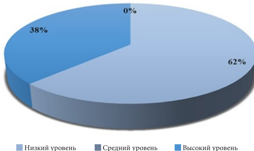
Рис. 1. Выраженность уровня индивидуальной саморегуляции у осужденных женщин