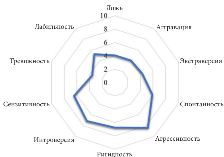
Рис. 2. Представленность личностных характеристик осужденных женщин с низким уровнем индивидуальной саморегуляции (М)

эмоциональные вспышки, причина которых, как правило, кроется в отсутствии эффективных стратегий саморегуляции индивидуального поведения.