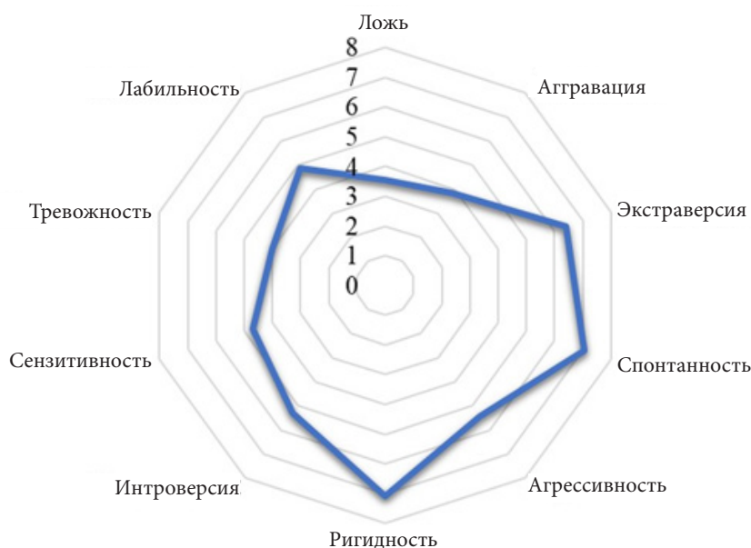
Рис. 3. Представленность личностных характеристик осужденных женщин со средним уровнем индивидуальной саморегуляции (M)

Представители второй группы со средним уровнем саморегуляции поведения отличаются высокими показателями ригидности ( M = 7,08 ) (рисунок 3; таблица 1). При этом снижение подвижности, переключаемости и выраженности адаптации психических процессов к меняющимся требованиям среды связаны у осужденных женщин прежде всего с эмоциональными процессами, которые не проявляются внешне, но приводят к качественному расстройству эмоционального спектра, провоцируя появление эмоциональной негибкости. В связи с этим А. Н. Певнева утверждает, что «эмоциональная ригидность высвечивает индивидуальные различия в способах переработки информации и проявления однообразных эмоциональных откликов на изменившиеся предметы эмоций, константность оценки событий, а также адаптивные способности и свойства личности» [11, с. 92]. Очевидно, что полюс эмоциональной реактивности может рассматриваться как значимый компонент индивидуальной саморегуляции поведения среди осужденных, отбывающих наказание в местах лишения свободы.